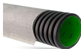
Жёсткая двуслойная труба «Ростпайп» SN10 с перфорацией с геотекстилем