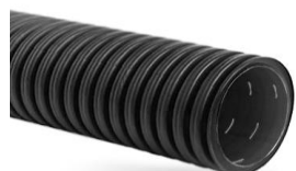
Двуслойные гибкие ПНД SN6 с геотекстилем