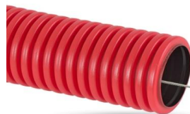
Двуслойные гибкие электротехнические трубы SN6 с протяжкой в бухтах