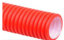
Двуслойные жёсткие электротехнические трубы SN8 в отрезках