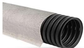
Однослойная с перфорацией в геотекстиле