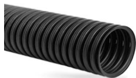
Однослойная с перфорацией без геотекстиля