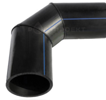
Отвод сегментный 50 - 90°