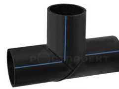
Тройник 90° сегментный