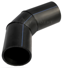
Отвод сегментный 5 - 45°